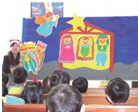
▲每一年永和天主堂教友們都會製作與主題相關的可愛大型道具，為小朋友講述精彩的故事。