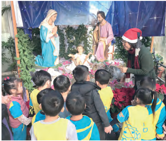
▲小耶穌在馬槽誕生的這一刻，打開了孩子們的心與眼，讓他們開始認識天主。