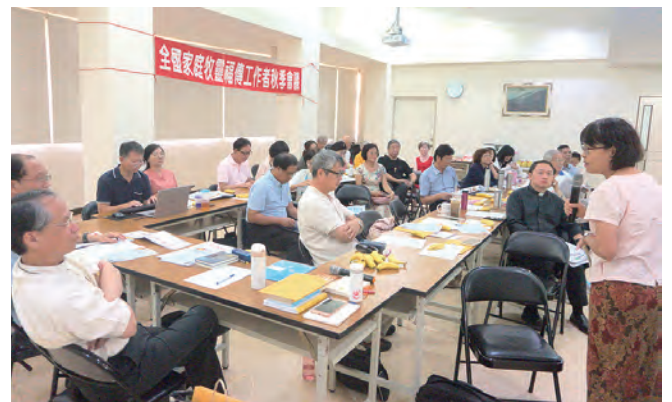
▲與會者認真聽取家庭牧靈福傳工作者在2018年的家庭相關工作報告 ▲全國家庭牧靈福傳工作者同心合意服事，向聖化家庭邁進。