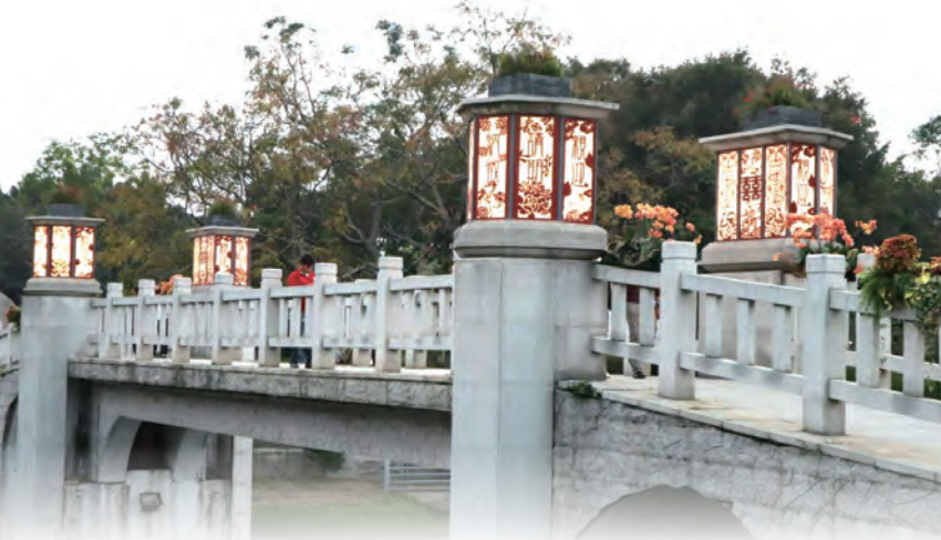
▲在台中豐原舉辦的花卉博覽會，禮花橋上的宮燈書寫著中華文化傳統的結婚6禮。 ◀耶穌在加納婚宴中行了第1個神蹟——變水為酒，明示婚姻聖事的重要性及不可拆散性。(輔仁聖博敏神學院禮儀研究中心)

納采 ：納采是六禮中的第1禮，當男方選定意中人之後，就請媒妁向女方提親，女方答應議婚後，男方再備禮請人前去求婚。男家所備的禮物因古代的身分地位等級不同而有所區別，即公卿用羔羊，大夫用雁，士用雉；後來一律改用雁，古人以為雁是候鳥，順陰陽往來，象徵男婚女嫁，合乎陰陽，並且還認為雁失去配偶後，終身不再成雙，以取忠貞，但有些地方很難找到雁，就以雞或鶩代替，台灣即是一例。