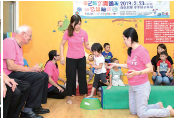
▲透過早期療育的服務介入,讓慢飛天使的家庭在支持下得以安心穩定地向前邁進。