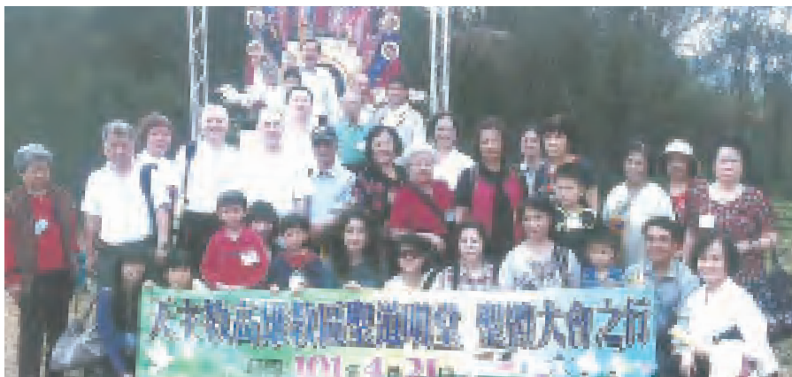
▲與道明會第三會教友們參與聖體大會合影留念