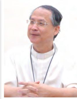
▲李克勉主教暢談參加世界家庭會議的豐收，期許下屆有更多家庭參與。