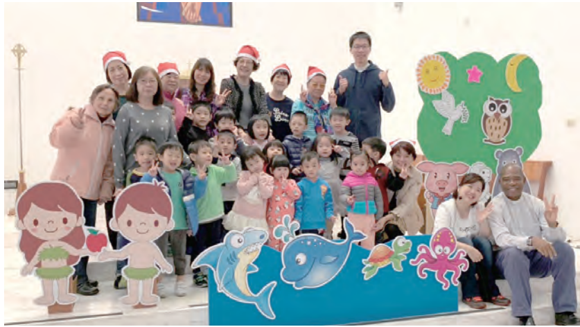
▲永達幼兒園在參觀活動結束後與神父及志工們合影。