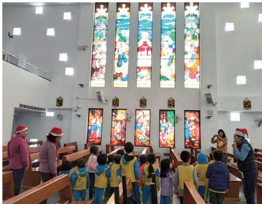
▲聖堂內光華璀璨的玻璃彩繪，蘊含著許多聖經故事，小朋友聽得津津有味。

接著便是重頭戲「聽故事時間」，從第1年的「耶穌誕生」、「挪亞方舟」，一路講到「創世紀」，不但有超級卡哇伊的大道具做為輔助，也設計了與孩子互動的橋段，例如讓他們參與表演，或是一起跳舞律動；而幾位曾經來過的小朋友，很得意地向其他孩子介紹：「這