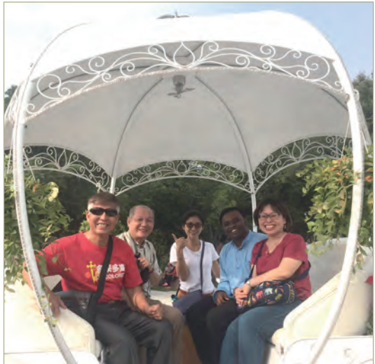
▲大夥兒童心未泯地乘坐「花轎」，沾染福氣。

「夫妻生活及恩愛的密切結合，是由造物主所建立，並由於祂賦予固有的法則。婚姻的建立者是天主自己。」《聖經》確定男女是為了對方而受造的：「人單獨不好，要給他找一個相稱的助手。」女人是男人的「骨中之骨，肉中之肉」，也就是說，與他配對的她，與他平等的她，與他最親近的她，是天主賜給他作為「相稱的助手」；「為此，人要離開自己的父母，依附自己的妻子，二人成為一體。」(參閱創2:18-24)這意味著，他們兩人的生命將永遠結合在一起。天主曾經親自說明這種結合，祂使人想起了造物主「最初」的計畫：「他們不是兩個，而是一體了。」(瑪19:6)