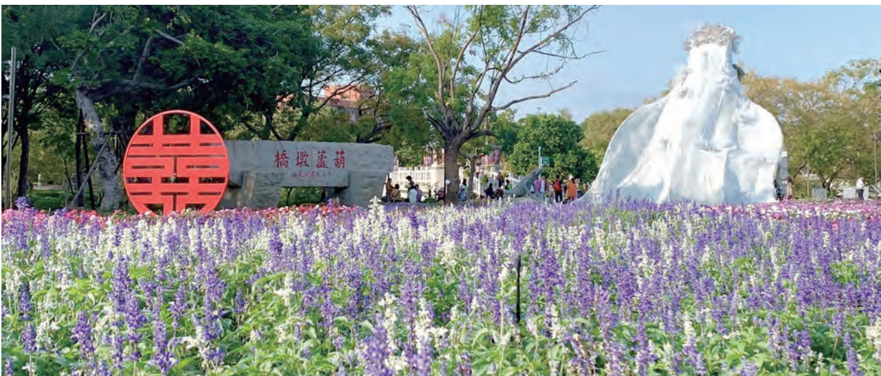
▲禮花橋四周充滿福氣